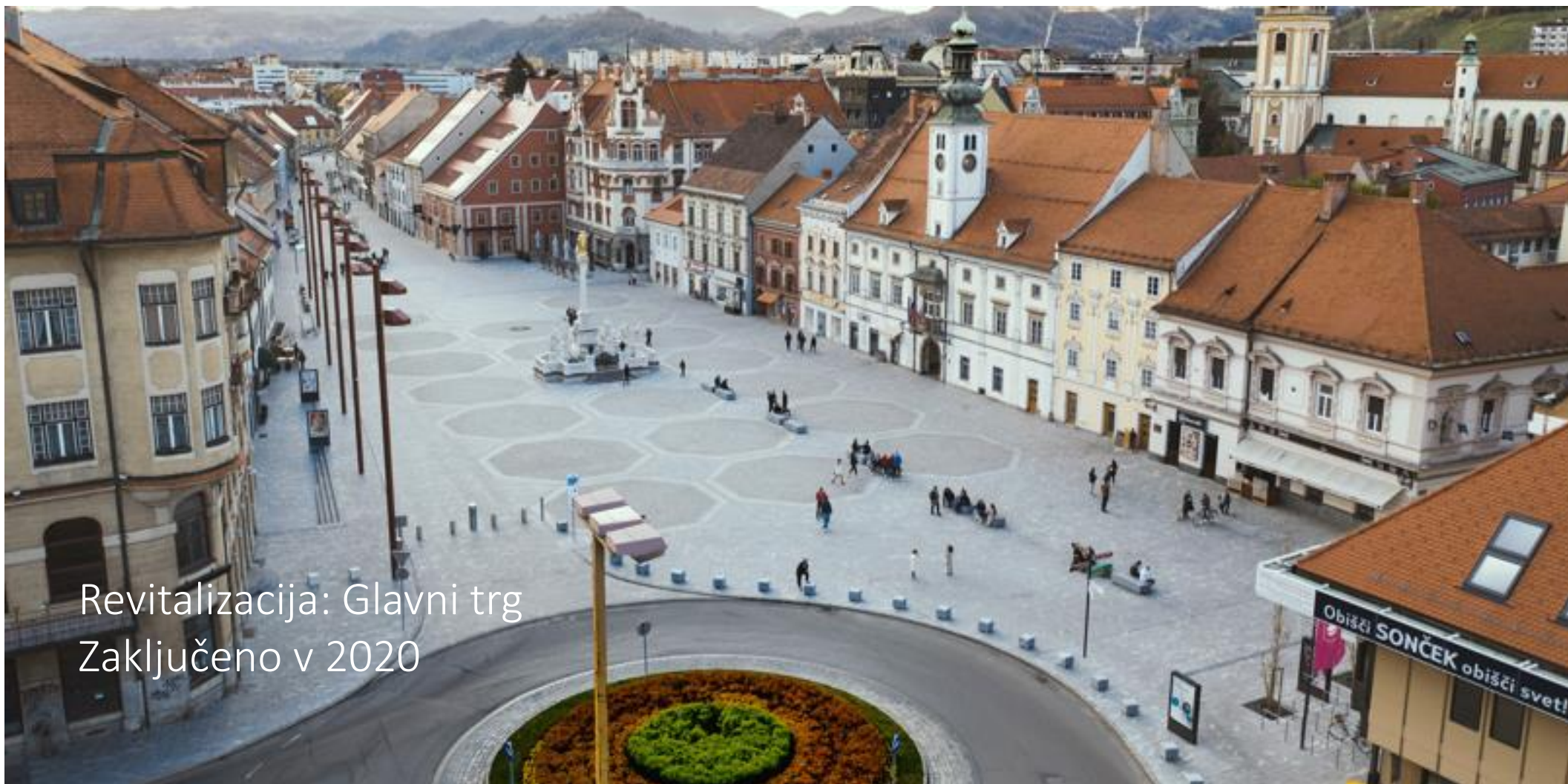
Revitalizacija: Glavni trg Zaključeno v 2020