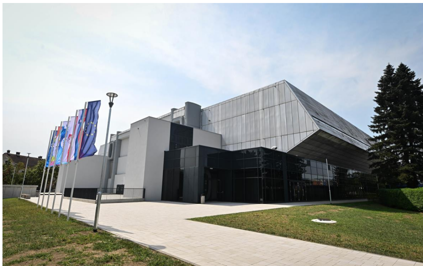
ŠPORTNA DVORANA TABOR Ponovno odprtje: avgust, 2022