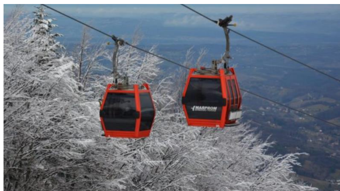
NAKUP ŽIČNIŠKIH NAPRAV NA POHORJU 2022