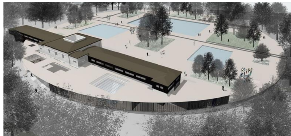
Renovacija: MARIBORSKI OTOK, kompleks kopališč Dokončano do: 2024