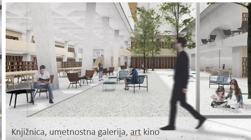
Knjižnica, umetnostna galerija, art kino