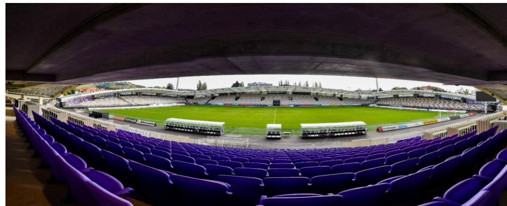
Renovacija: LJUDSKI VRT (nogometni stadion) Dokončano v: 2021