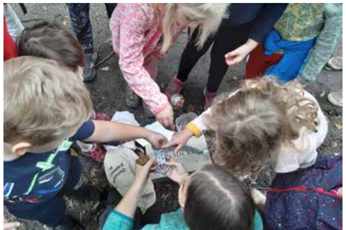
oblikovanje: Tilen Basle, ilustracija: Samo Jenčič.